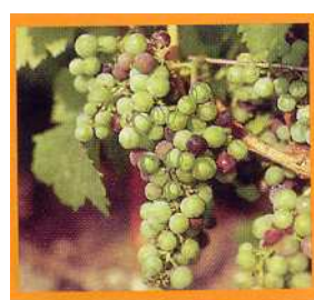
Stade 35 Début véraison