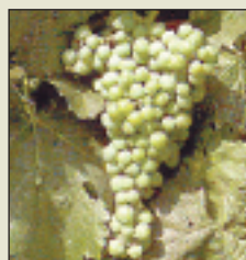
Stade L 33 Fermeture de la grappe