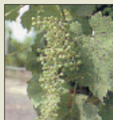
Stade K 31 Grain de pois (6 à 8 mm)

Les premiers arrêts de croissance sont notés en zone tardive sur sol superficiel.